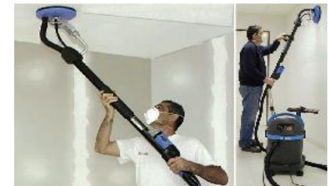
Inhalation de poussières