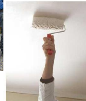
Inhalation de produits